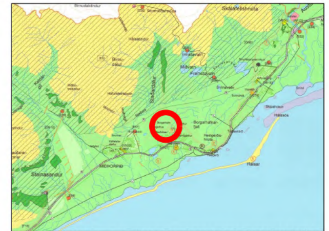
Hluti af sveitarfélagsuppdrætti Aðalskipulags Hornafjarðar 2012-2030